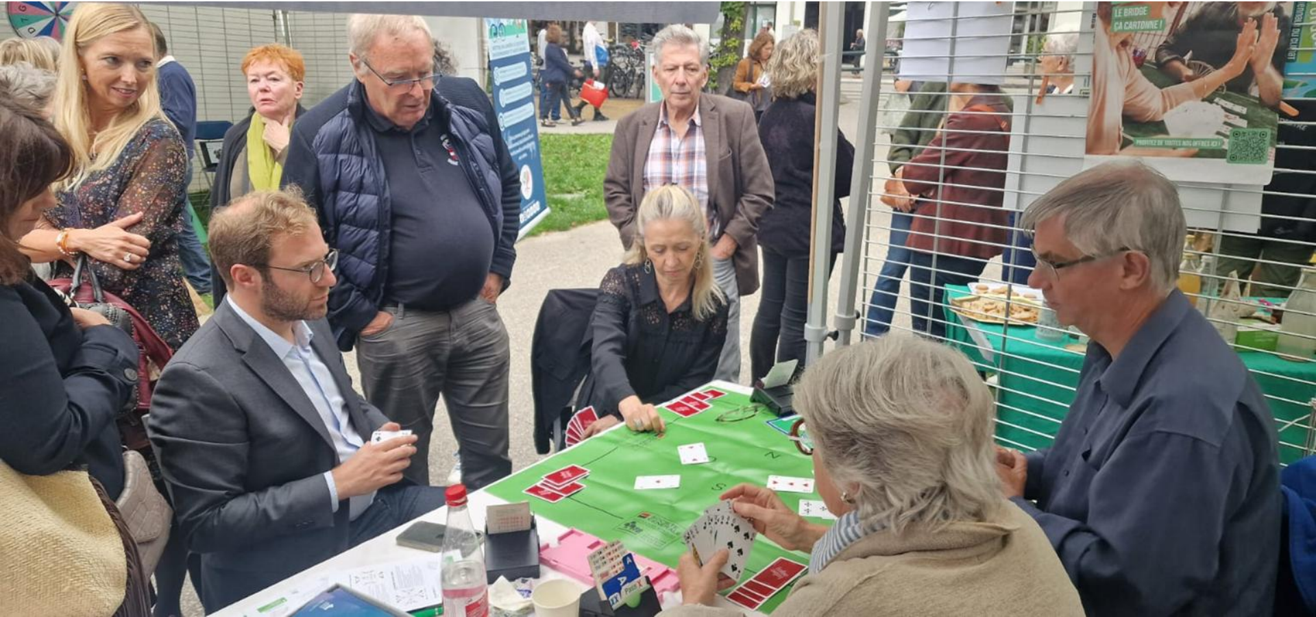
Antoine Armand, député, ministre, et.. BRIDGEUR